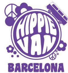
Nekaj primerov mojega dela pri podjetju Barcelona-Home in Capture Models.